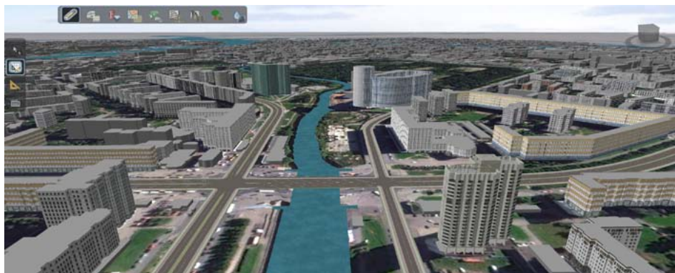
Вид модели после прокладки дорог, наложения данных спутниковой съемки и полуавтоматического распределения фасадов

E-mail: cad@pss.spb.ru Сайт: www.pss.spb.ru